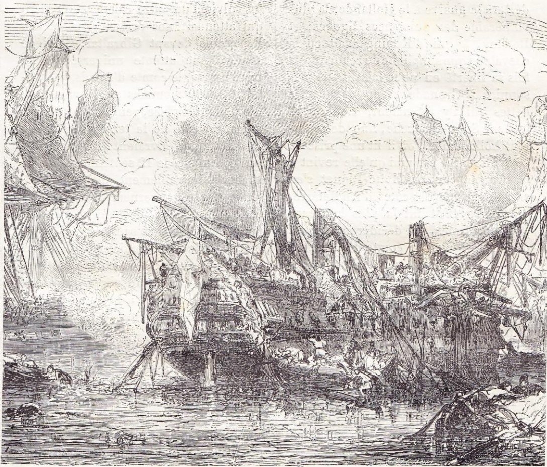
Combat naval de Trinquemalle (3 septembre 1783).

On se consola de cette entreprise manquée par la prise de Grenade où d'Estaing était entré le premier. Cet